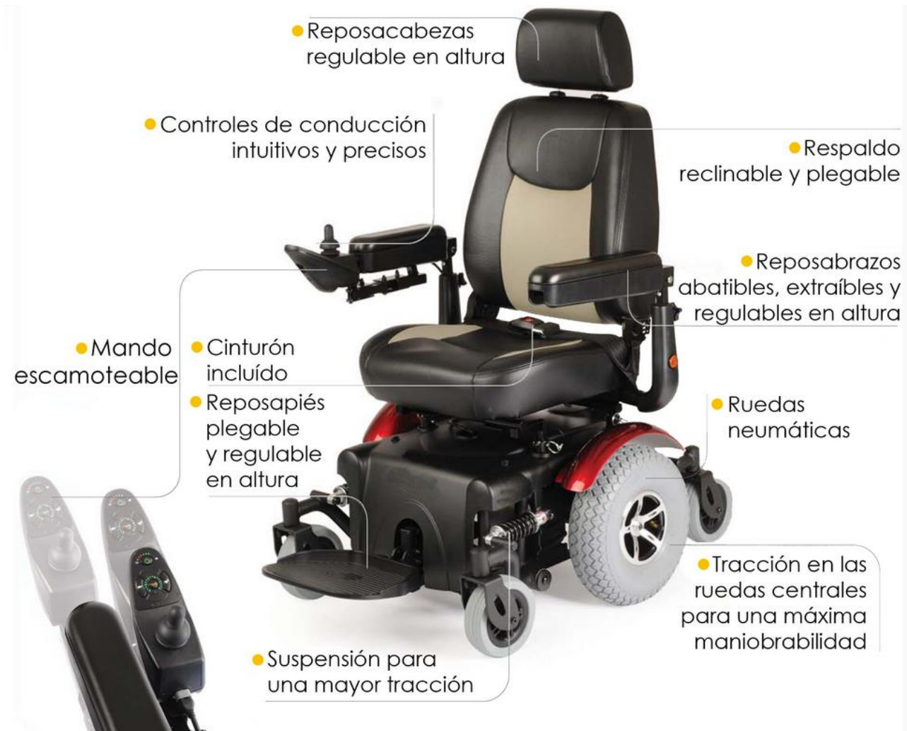
Figura 1. Componentes

Esta fotografía muestra la silla de ruedas R320. Ver las especificaciones para ver pesos y características más detalladas.